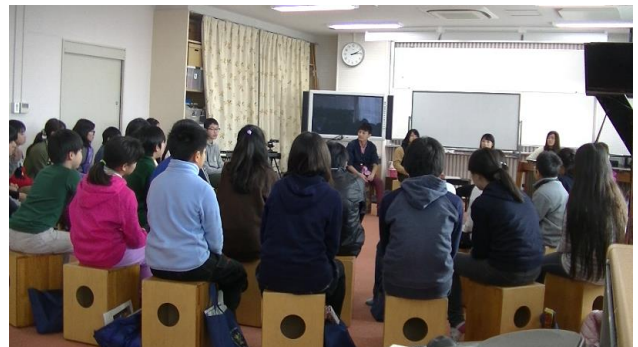
カホンに座って演奏者の話しを聞く児童の様子

今回は児童が座っているカホンを用いて、一緒に演奏する活動を取り入れた。子どもたちにとってカホンは身近な楽器であり、それを使って一緒に演奏できたのは、演奏者と児童どちらにとっても貴重な機会であったと感じた。