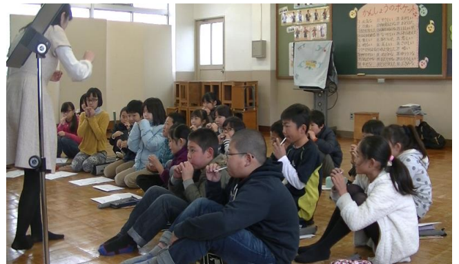
ストローのリードを吹く児童

オーボエのリードに似せて作ったストロー製のリードを使い、ダブルリードを吹く体験を取り入れた。また、2校時と3校時の間の休み時間には、児童らが奏者に近づいて行き、オーボエを間近で見せてもらっている場面もあった。ただ演奏を聴くだけでなく、このように奏者と児童の交流が見られたことは、アウトリーチを行ううえで、意義のあることだと感じた。