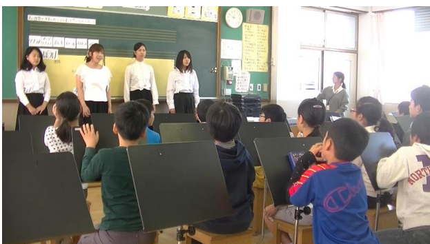
正面を向き、演奏者を見ながら鑑賞する場面