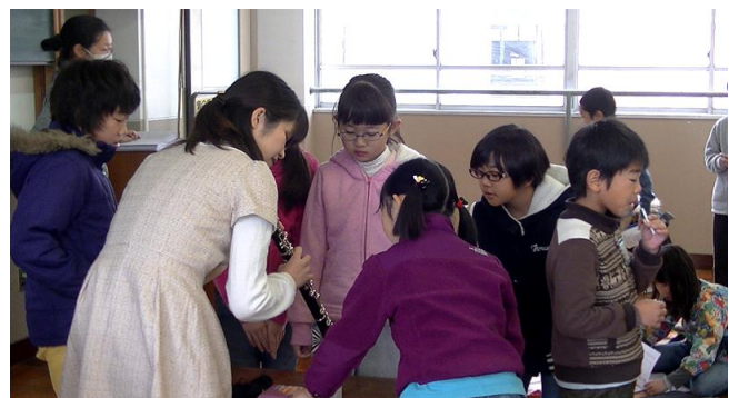
児童らが奏者にオーボエを間近で見せてもらっている場面