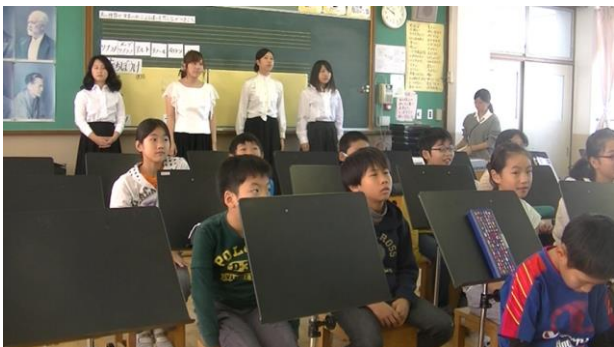
後ろ向いて演奏を聴く児童

次に、斉唱、重唱、合唱について知らせ、正面を向き演奏者が見える状態で、鑑賞をさせることで、演奏形態による声の重なり方の違いについて、ただ教科書で学ぶのではなく、目と耳で確かめながら学習をすることができたのではないかと感じた。