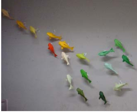
(壁を使った展示の準備段階)

机の上での展示とは別に、展示教室の壁を利用しての展示は、訪れた人から好評を得ることができた。壁を利用した展示作品を含めると、展示作品数は約 60 作品に及んだ。