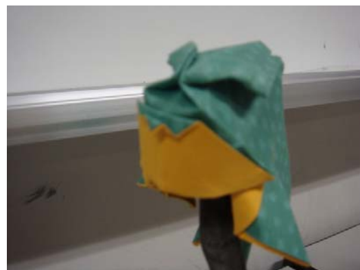
(構成員によるオリジナル作品)

東京大学には、現代の折り紙の普及と発展を目的にした「Orist」というサークルがある。このサークルは、設立から4年目でメディアにも多数取り上げられ、本も2冊出版するまでに至っている。本プロジェクトも、今回の反省点を活かし、教育大学としての特長を引き出した活動を続けていけば、「Orist」のような特色ある活動へと発展することが期待できる。