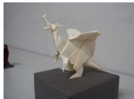
(構成員によるオリジナル作品)

現代折り紙の特徴である立体感を持った作品を中心に展示し、また構成員によるオリジナル作品の展示も行った。