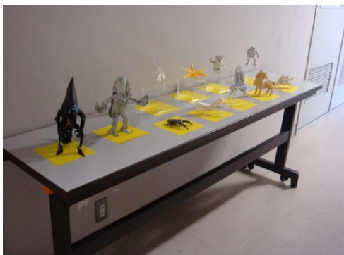
(西田シャトナーさん 作品)

たまたま通りがかった人、藤陵祭のパフレットを見て興味を持ち見に来た人、ワークショップの参加者など、3日間で約100人の人が展示を見に来てくださった。