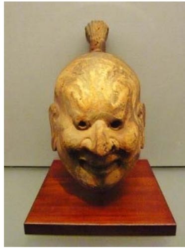
図 2 金剛 法 213 号 奈良時代