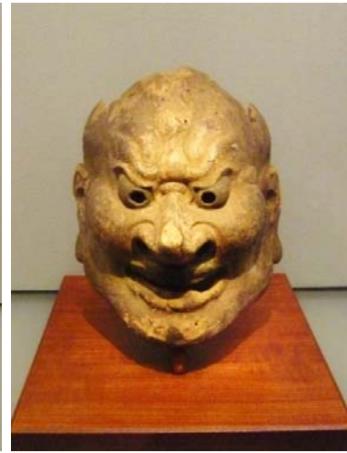
図 3 金剛 法 229 号 白鵬～奈良時代