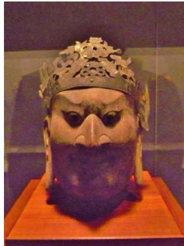
図 5 呉公 法 210 号 白鳳時代