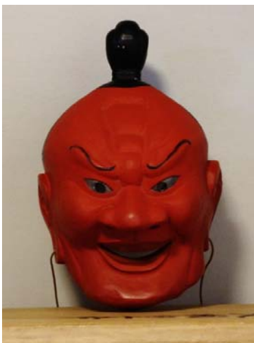
図 4 金剛