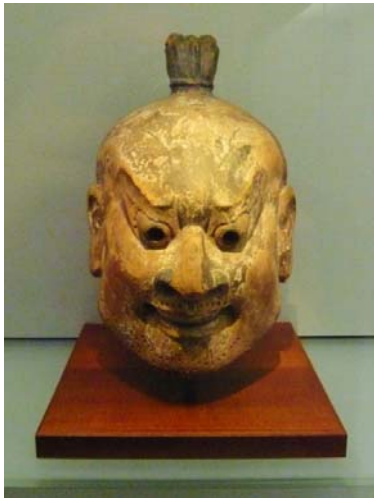
図 1 金剛 法 212 号 白鳳時代