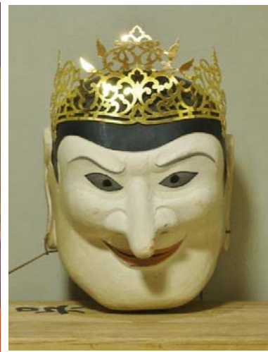
図 6 呉公