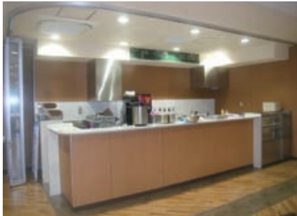
写真5. 大学会館1階談話室（調理カウンター）

本年度中には、中庭に面したところをウッドデッキにして、オープンカフェのような場所づくりを考えています。これまで、蚊の発生に悩み、その対策を考えてきました。そこで、できるだけ雑草が生えるのを防ぐため、中庭を雨が降っても水たまりができないインターロッキング舗装にするとともに、池の水を入れ替えて丁寧に清掃し、および周りの樹木の剪定をするなどして対応します。