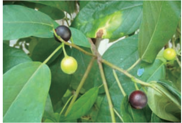
写真-3 イヌビワの木の实

郎の方が偉かったと思っている。実際、本当に薩長同盟を作ろうと走り回ったのは彼の方なのだ。龍馬は、最後の良い所取りをしたにすぎない。