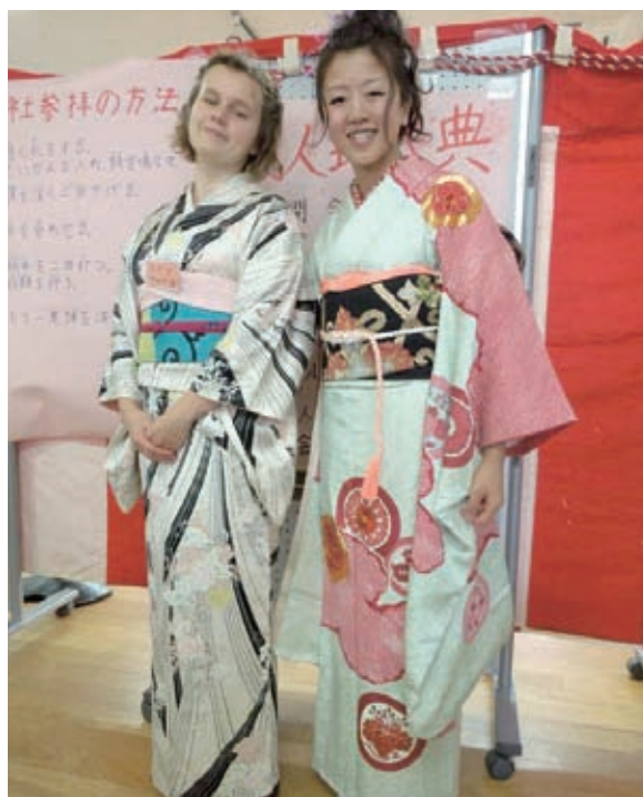
写真4. 成人式で着付けをはじめ、色々日本文化を体験してもらった。インターネットテレビも放送してくれた！