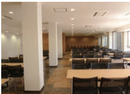
写真7. 大学会館の談話室の全貌

南棟2階には、小集会室が5室有り、少人数のミーティングや控室等に利用できるように美しく改修しました。また、中集会室が1室有り、視聴覚機器やインターネットなどが使用できる装置を備え、多目的に利用できる居室として整備しました。