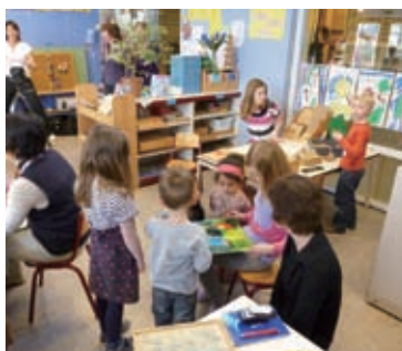
異年齢による授業風景

校舎の中にはいると、壁には子供たちや親たちが描いた動物や風景の絵があり、和やかな気持ちにさせてくれた。そして、自己紹介もそこそこで、教室に案内された。授業の合間に行われるサークルと呼ばれる活動中であった。このサークルもイエナプランの大きな特徴のひとつである。私が、案内されたのは高学年の教室で、子供たちは円になって座っていた。私たちのイスも用意されており、教室にはいると、「こんにちは」と日本語で挨拶をしてくれた。日本では小学校4年生から6年生に当たる子供たちがこの教室にいた。5年生の女の子が本日の担当で、昨日のテレビで見たニュースを説明し、自分の意見や感想を述べていた。発表が終わると、司会の女の子が、サークル内の子供たちに意見を聞く。すると、5、6人の手が挙がり、