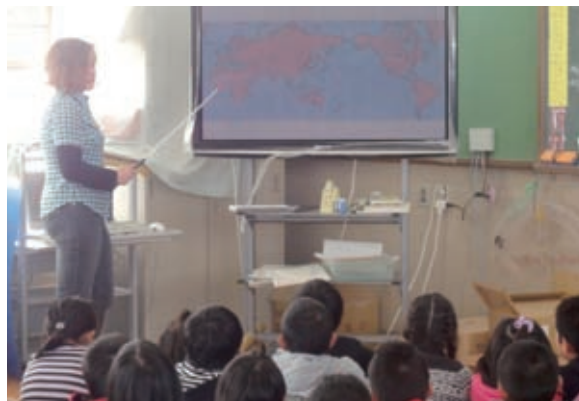
写真3. PICNIKの発表にて。児童たちが興味津々に聞いているのを見ると、自分自身や自分の文化に自信を持ち、自国に関する知識を伝えるのに意味があると感じ始める。

匹の猫を撫でたくても、ここを離れたくはない。確かに、新しい環境に慣れやすい私に改めて国で生活を送り続けるのはそんなに難しくはない気がする。日本以外の場所に行ってみたら同じようにその国と恋に落ちることも不可能ではない。それでも、もし将来何かの奇跡でもう一回ココに来るチャンスがあったら、もう戻れなくなるかもしれない。日本は愛し、京都はめっちゃ好きやねん。