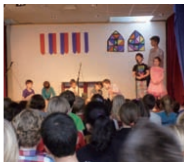
週1回開かれる全校発表会

さて、サークルが終わり、授業が始まるが、そこにチャイムは鳴らない。子供たち自らが、授業の準備にとりかかる。自分がやりたい勉強は、自分で考え、自分で授業を選ぶ。1週間の授業内容は、自分で選択するのだ。先生は、それにアドバイスをするだけ。だから、クラス一人一人の時間割がちがうのである。そのため、自分の選んだ授業の教室に自ら移動するのである。そして、教室には異年齢の子供たちが集まる。