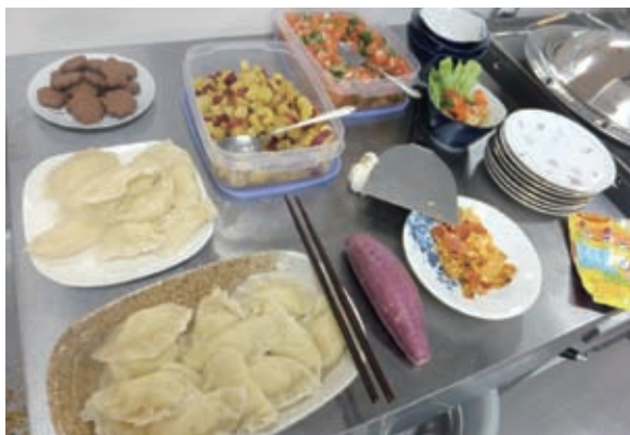
写真1. 3月にサラダボウルフェスタでポーランド料理を作って参加者に味見してもらった。自慢するつもりではないけど、美味しくできた！

一年間はあっという間に過ぎてしまったが、そのうちに日本、特に京都を愛するようになった。どんなに実家に帰りたくて、家族や友達に会いたくて、家の3