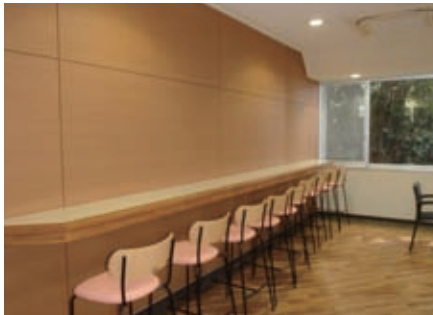
写真6. 大学会館1階談話室（壁設置テーブル）