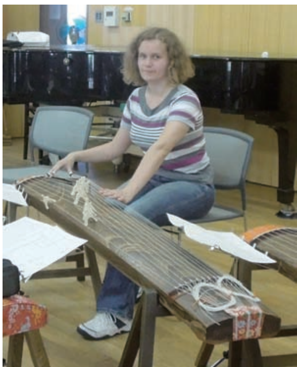
写真2. 今学期の始まりから琴を習っていて、2曲弾けるようになった。

匹の猫を撫でたくても、ここを離れたくはない。確かに、新しい環境に慣れやすい私に改めて国で生活を送り続けるのはそんなに難しくはない気がする。日本以外の場所に行ってみたら同じようにその国と恋に落ちることも不可能ではない。それでも、もし将来何かの奇跡でもう一回ココに来るチャンスがあったら、もう戻れなくなるかもしれない。日本は愛し、京都はめっちゃ好きやねん。