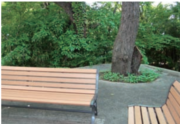
写真-4 中央広場ベンチ裏のイヌビワ (奥の木の下に広がっている)

こうして、イヌビワコバチは実の内部という安全な場所に産卵することができ、イヌビワはイヌビワコバチに花粉を媒介してもらって確実に受粉できる。両者は、きわめて強い共生関係にあるといえる。7月頃、イヌビワの実をとってぜひそとと割ってみてほしい。たくさんの子房の中に黒ずんだものがあれば、針先で子房を割ってみると、眠っている小さな八チを見つけることができる。子供たちの目の前で、これをやってあげると、必ず大きな歓声をあげる。