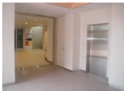
写真3. 玄関通路（自動扉とエレベータ）

食堂や購買部などがある北棟の3階にある共通演習室5室と和室を改修し、新たに空調設備を取り付けることによって、より綺麗で快適に使用できる場所となりました。