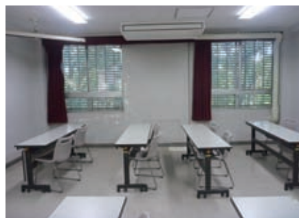
写真4. 共通演習室の空調設備

食堂や購買部などがある北棟の3階にある共通演習室5室と和室を改修し、新たに空調設備を取り付けることによって、より綺麗で快適に使用できる場所となりました。