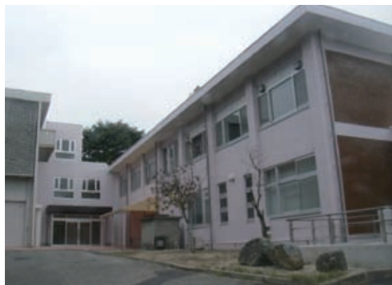
写真1. 大学会館の全貌

全国の国立大学でも、大学の敷地における木々の緑の占有率が高い京都教育大学は、京都の伏見にある下町情緒の豊かな環境で、学生をはぐくむ守（モリ）の大学です。この数年、改修や改築が進み、学生の講義室・学習室や教員の研究室、学生や教職員が利用する大学会館、そしてラーニング・commonsを備えた図書館、などの施設設備の整備がなされてきました。その中でも、学生の皆さんにとって仲間とお茶を飲んだり語り合ったり、一人ゆっくり休憩したりする場所である大学会館が、より便利により綺麗に、この度、改修・改築されました。