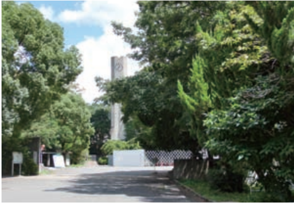
写真-1 右下にイヌビワ、給水塔下にマテバシイが見える

B棟北側、運動場との間の道路から食堂の方を眺めると、たくさんの魅力的な木が両脇に生えている。その中から、二本の木の実に関わる断りをしてみよう。いずれも、私の故郷の思い出とも繋がっている。