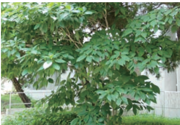
写真-2 イヌビワの木

高知県北川村に「モネの庭」がある。余計なことだが、北川村はかの中岡慎太郎が生まれた村であり、私はその隣町で生まれたので、坂本龍馬よりも中岡慎太