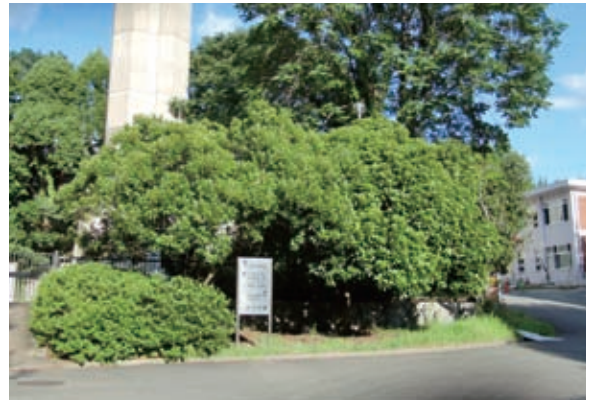
写真-5 給水塔下のマテバシイ

シイの実やアラカシなどのドングリ類は、教材としても魅力的である。クッキーの材料にもなるし、小さなコマやヤジロベエなどのおもちゃを作ることもできる。もっとも、アラカシなどはタンニンが多くて、そのままでは食することができない。シイの実だけは、そのままでも何の問題もなく食することができるので、子供たちと一緒に拾って、煎って食べたり、クッキーを作ったりしてほしい。総合的学習や生活科などの豊かな教材となること間違いなしである。