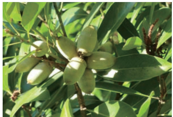
写真-6 マテバシイの実