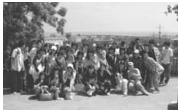
マラッカ海峡を望んで（マラッカにて）

「交流と体験」の多くの思い出を胸に詰め、全員無事帰国。張りつめていた緊張も解け、「良かったあ」とある教員。