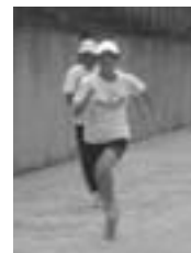
陸上部でのクラブ指導中の1コマ。生徒とともに走る。

今後も、自分自身が自然の様々なことに疑問を持ち続け、少しずつでも生徒の「心」を動かすことができるような授業ができるよう頑張っていこうと思います。