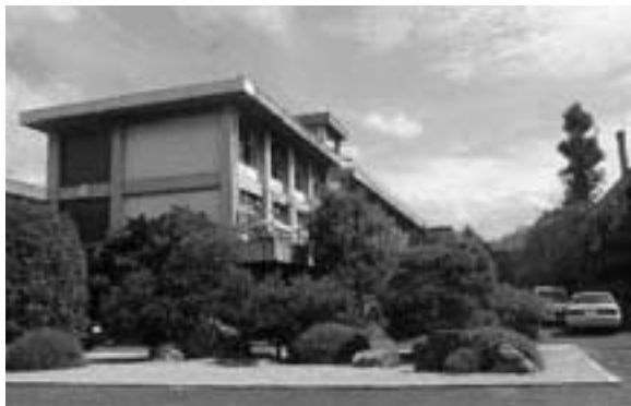
緑あふれる校内風景

これは、私が3年学年主任をしていた2000年の10月に、学年通信に記した一節です。附属京都中学校は、このように、都会にありながら四季の移ろいを肌で感じることができる環境に恵まれています。校内にあふれる木々は、紫明通の緑樹帯の木々とも一体となり、多くの野鳥が訪れます。この地は、京都教育大学の前身、京都学芸大学のあった場所。現在の大学キャンパスが緑にあふれているのも、こうした伝統が継承されているのかもしれない。